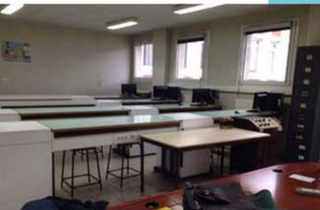
< Voici la classe de BTS ATI de M. Degorgue.

C'est un artiste mythique de la scène graffiti, identifié comme étant un troubadour. Après avoir parlé de sa biographie, la professeure a montré au tableau deux œuvres de cet artiste. Les élèves ainsi que nous avons dû les décrire. La première a été faite pour passer un message par rapport aux migrants. Sur la deuxième œuvre, on peut observer un célèbre radeau de Géricault (mouvement romantique) et un autre bateau lui plutôt moderne. Nous trouvons que le cours a vraiment été intéressant.