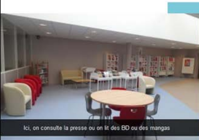
< Kiosque presse du CDI du Lycée Carnot, Bruay-la- Buisière